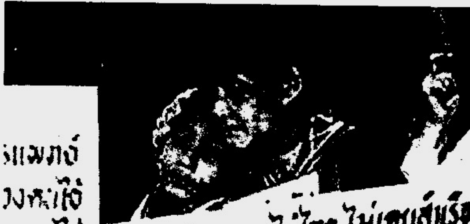
แม่ของน้องไอ้โง่ การเรียกร้องสิทธิของคนไอ้โง่ ไม่เคยสิ้นเรื่อง

น่าสังสัยเป็นที่ยิ่งว่า ทำไมแพทย์จึงโดนกล่าวหาจากผู้ป่วยหรือถูกตั้งข้อกังขาจากสังคมอย่างมากในปัจจุบันนี้ เกิดอะไรขึ้นกับความศรัทธาและความน่าเชื่อถือที่สังคมไทยเคยให้ความเคารพและยกย่องแพทย์อย่างมาก ทำไมถึงเกิดความเสียหายศรัทธาต่อแพทย์อย่างรุนแรงดังที่ปรากฏเป็นข่าว คำถามที่ตามมามีก็คือ เกิดอะไรขึ้นกับวงการแพทย์ในปัจจุบันนี้